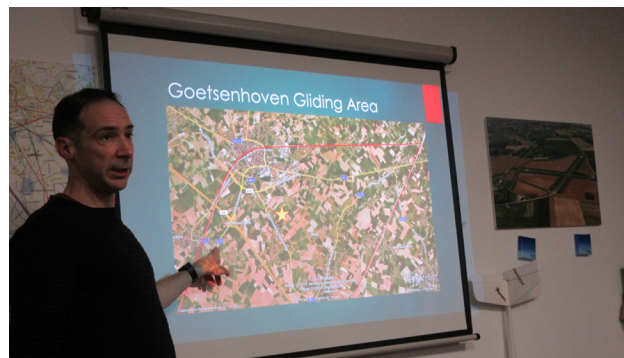
LUCHTRUIM REFRESHER DOOR MATTIJS

Voor 2026 staan er weer tal van activiteiten op de planning, waaronder een symposium in Oostmalle, de Vrouwevliegdag in Weelde en het jaarlijkse zweefkamp in juli. Daarnaast worden er op 5 en 6 september opendeurdagen georganiseerd in samenwerking met ULM Goetsenhoven.