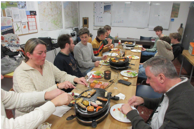
ER WERD LEKKER GESMULD TIJDENS ONS KERSTFEESTJE