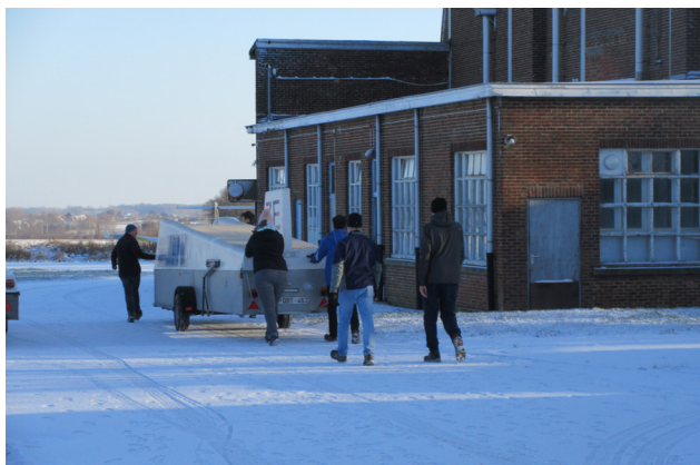
ZELFS IN DE SNEEUW GING ONS WINTERWERK DOOR