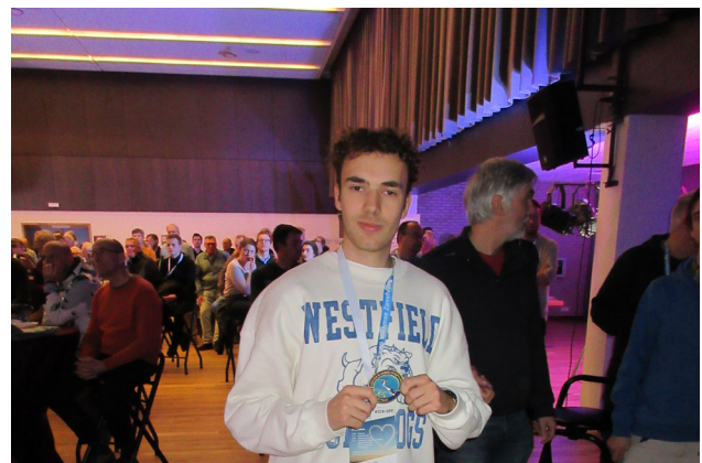
OBI ONTVANGT ZIJN SPL VERGUNNING