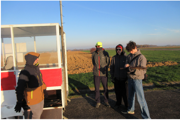
HET WERD EEN GUUR KERSTKAMP